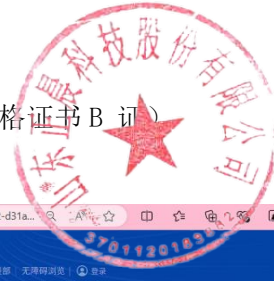
6-1-3 吴西国安全生产考核证书及网查截图（安全生产考核合格证书B证）