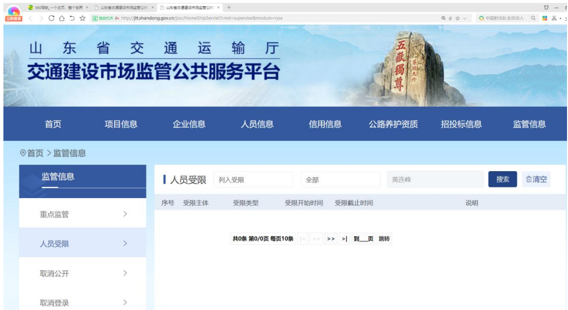
“山东省交通建设市场监管公共服务平台”黄连峰无投标受限情形网页截图 (http://jtt.shandong.gov.cn/jssc/HomeShipServlet?cmd=supervise&module=rysx)